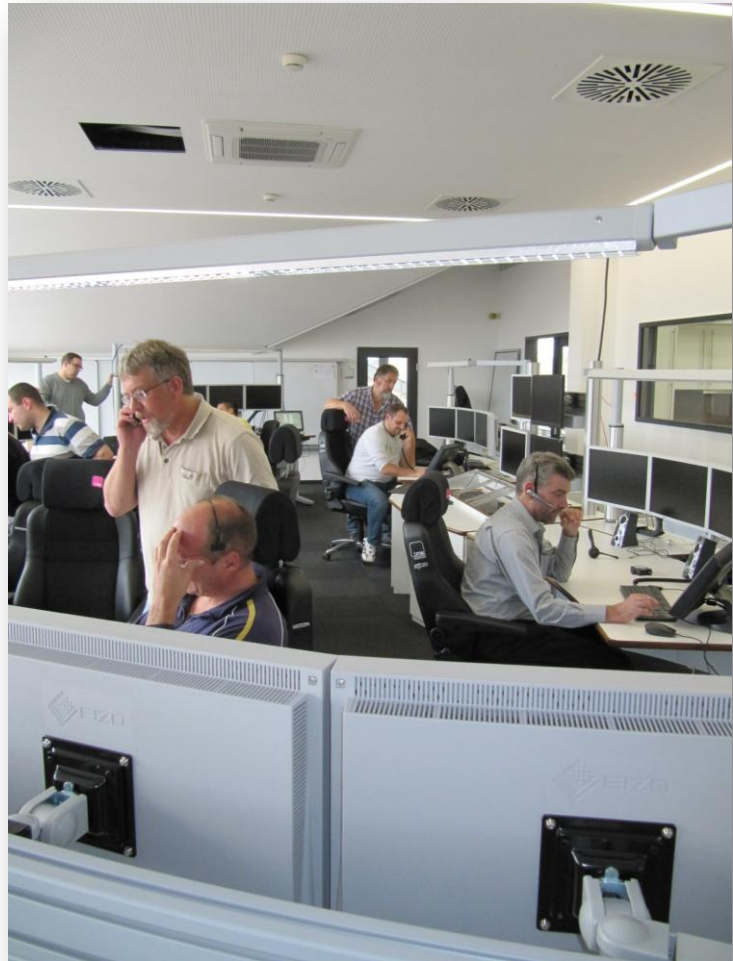
Bild 3: Schulung / Training der Disponenten an der neuen TK-Anlage

Im Internet: www.landkreis-ravensburg.de/bks www.kreisfeuerwehrverband-ravensburg.de