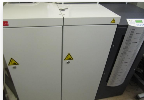
Bild 4: Ebenfalls bereits in Betrieb: die neue USV-Anlage für die Regionalleitstelle Oberschwaben